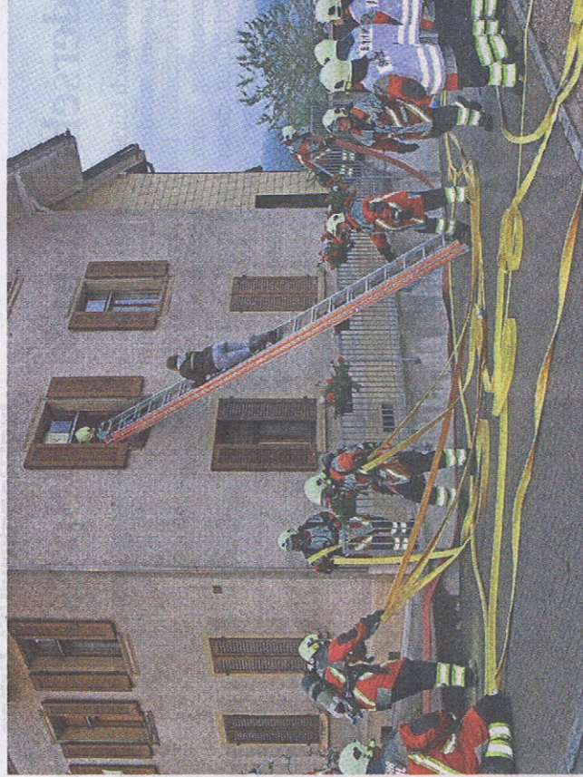
Feuerwehr Safenwil: zum Einsatz bereit!

Der Kommandant der Safenwiler Feuerwehr, Niggi vonder Mühl, betreu-